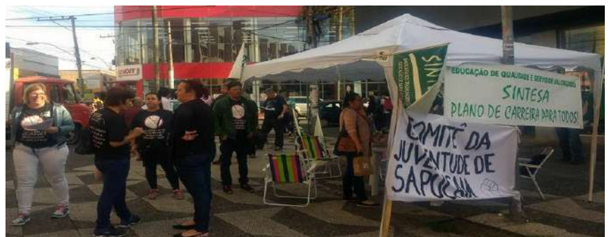
10 DE NOVEMBRO