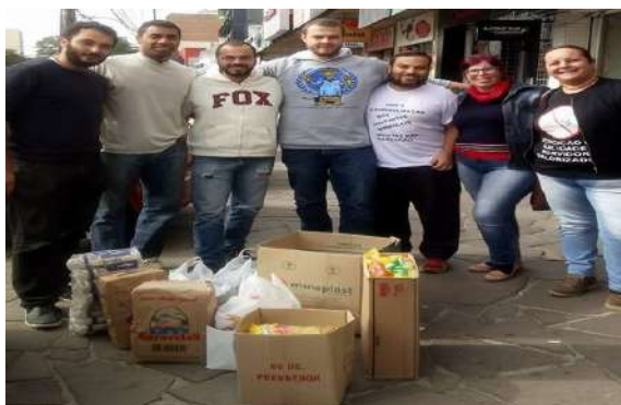
SOLIDARIEDADE AO MUNICÍPIOS DE CACHOEIRINHA