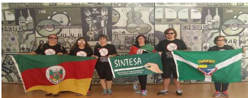
Ocupa Brasília 24 de maio