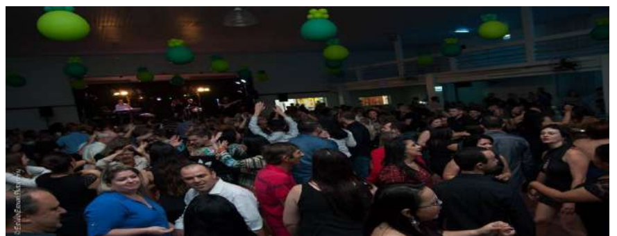
14 ANOS DE LUTA E INTEGRAÇÃO