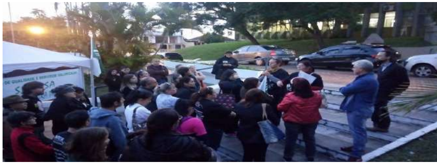
ENTREGA DA CONTRA PROPOSTA DA DATA BASE