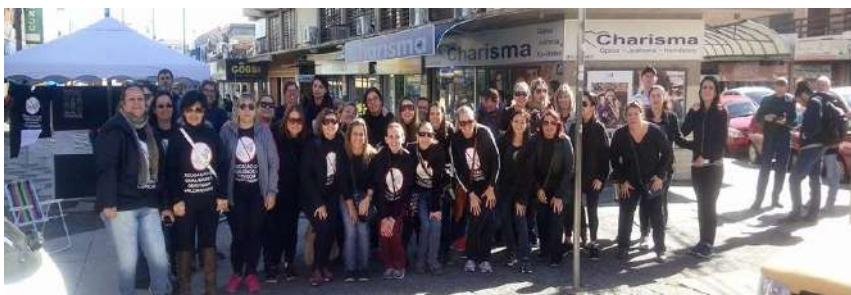
GREVE GERAL 28 de Abril