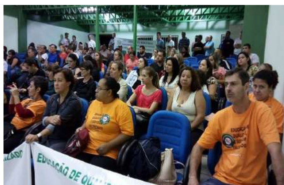
CONTRA A RETIRADA DE DIREITOS