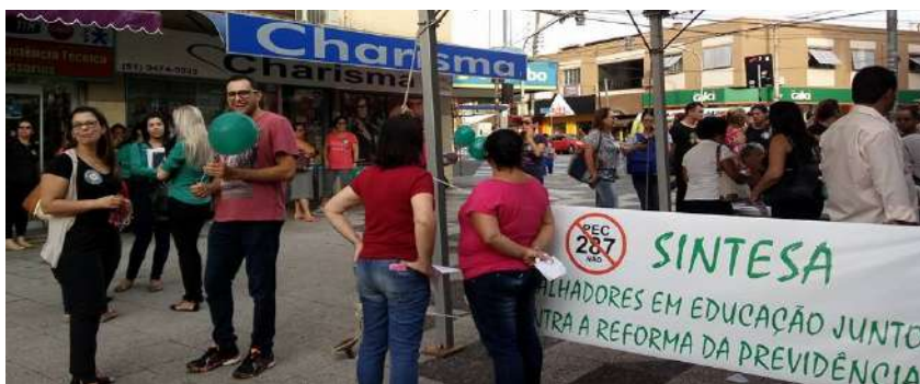
15 DE MARÇO