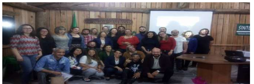
1º DE SETEMBRO: Posse dos representantes sindicais