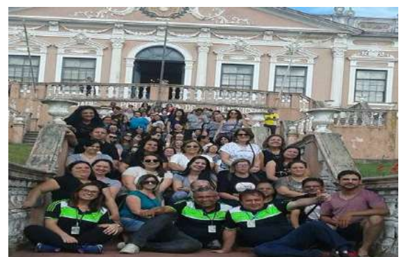
02 DE DEZEMBRO - BAGÉ