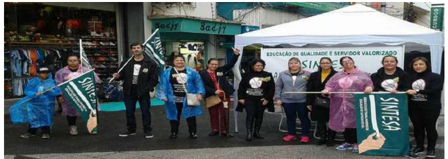
GREVE GERAL 30 DE JUNHO