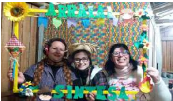
ARRAIAL DO SINTESA.