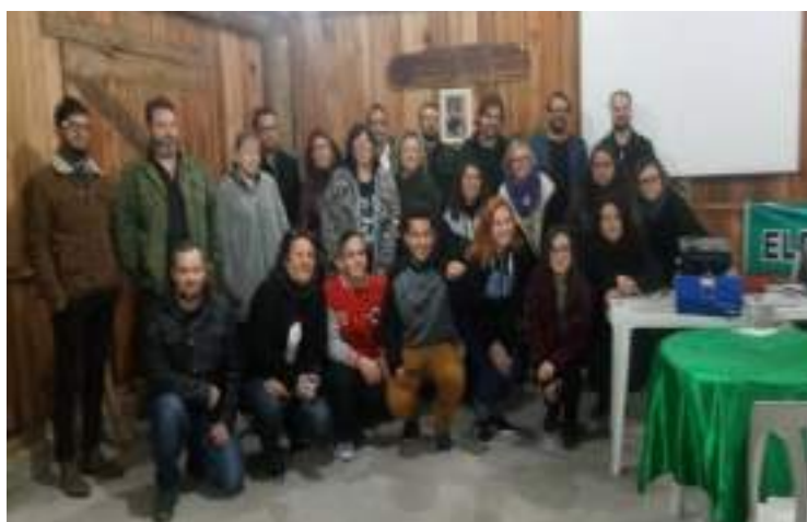
ESCOLA SEM MORDAÇA.