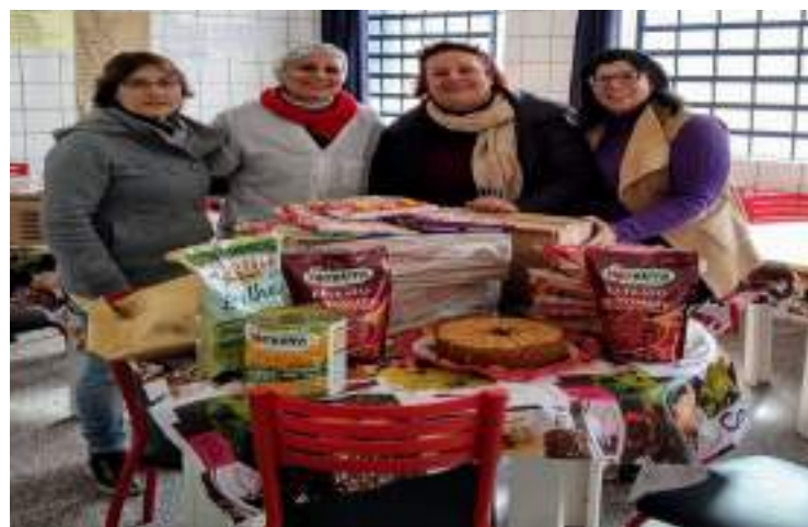
SOLIDARIEDADE: DOAÇÃO À ACAPASS.