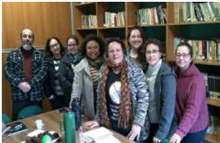
ENCONTRO DOS SINDICATOS DA REGIÃO METROPOLITANA.