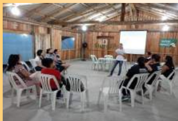
Formação Sindical - 10/04