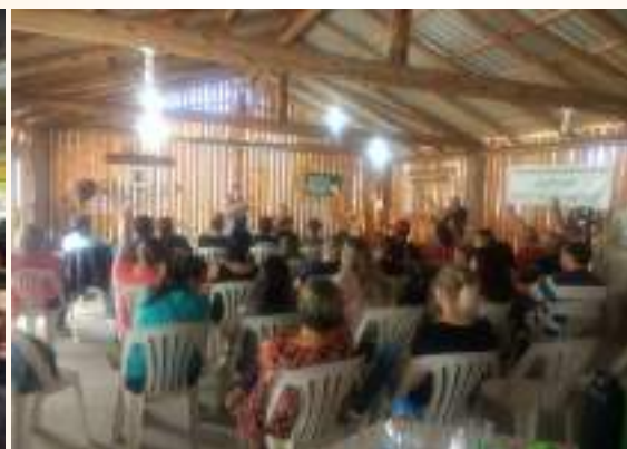
Eleição conselheiros FUNDEB E CAE - 16/03