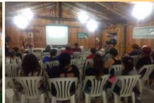
Apresentação do Projeto de Inciativa Popular - Eleição de Diretores e vices das Escolas Municipais - 05/04