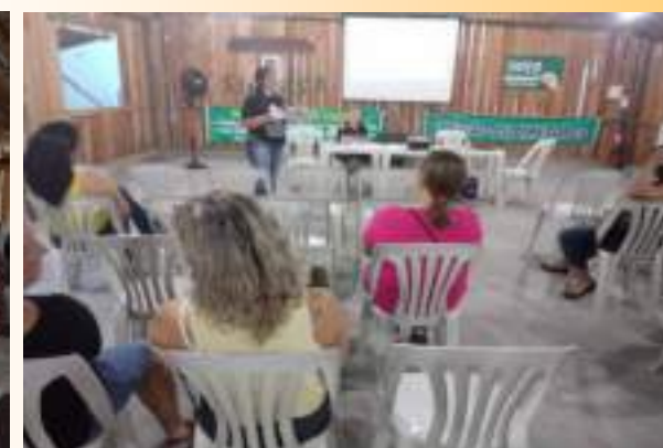
Assembleia e formação sindical - 24/04