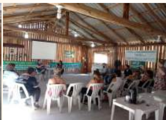
Reunião Representantes Sindicais - 13/04